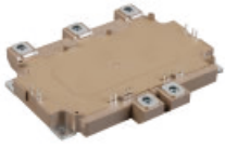
GVB 系列 750V / 400A