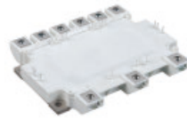
GVC 系列 750V / 400A