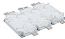
GV 系列 750V / 600A, 820A, 950A