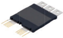
SSC 系列 Si 750V SiC 750V / 1200V